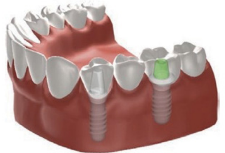
Figuur 3: brug op twee implantaten