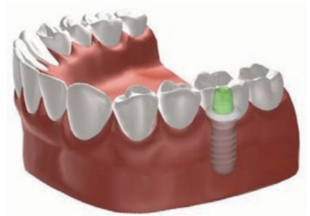
Figuur 2: kroon op een implantaat