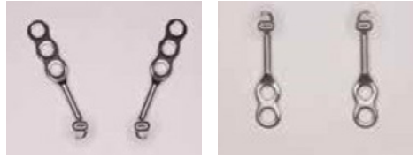
Figuur 1: Bollard© botankers voor de bovenkaak (links) en onderkaak (rechts)

* De informatie en uitleg in deze folder is ook van toepassing op kinderen en tieners.