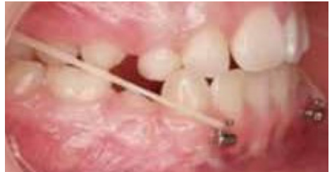
Figuur 2: Bollard© botankers voor de behandeling van een diepe beet (boven) en een te snel groeiende onderkaak (onder)