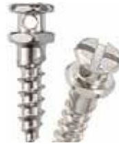
Figuur 3: orthodontische schroefjes (vergroot weergegeven)

Een orthodontisch schroefje is een heel klein schroefje van zes tot twaalf mm lang (figuur 3). Het is gemaakt van metaal (titanium). Een schroefje is gemakkelijker te plaatsen en te verwijderen dan een botanker, maar is ook minder sterk. Uw orthodontist en kaakchirurg overleggen van tevoren met u wat in uw geval het beste is: een botanker of een schroefje.